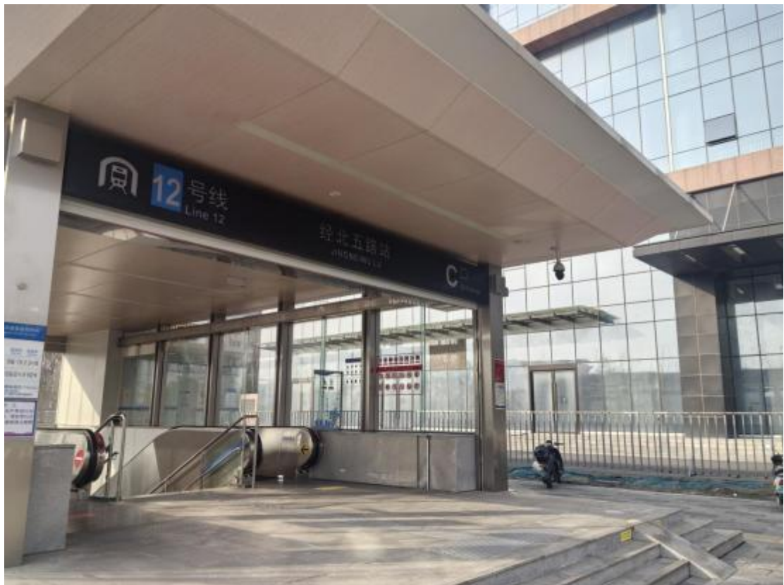
地铁 12 号线经北五路站 C 口